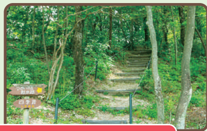
四季路 スタート位置